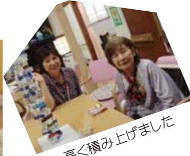
高く積み上げました