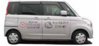
2台目は軽自動車 H25年4月に納車されました。

る反面、ご利用者がリラックスして楽しい気持ちになれるように様子を見ながら声かけをして会話をすることにも気を配っています。今デイでは運転手不足で大変ですが、みんなで力を合わせて『テディの家』のため「ご利用者」のためにこれからも「安全第一」で頑張っていきたいと思っていますのでよろしくお願い致します。