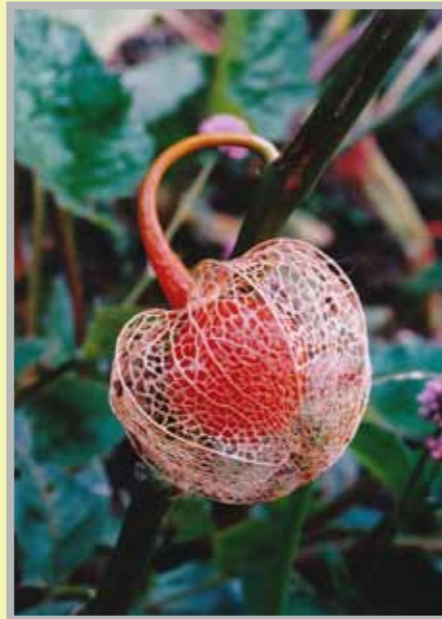
大森隆さんの作品