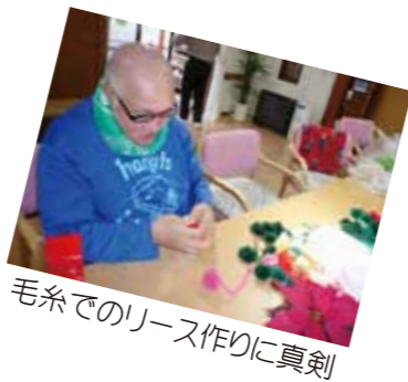
毛糸でのリース作りに真剣