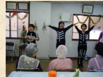
「骨まで愛して」ガイコツをかたどった衣装で