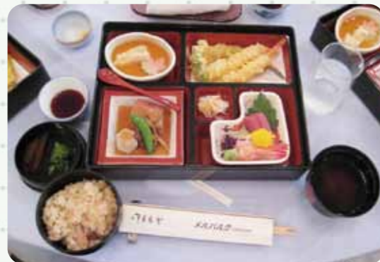
メルパークでの食事は松花堂弁当。 美味しく頂きお腹もいっぱい。 …でもデザートは別腹。