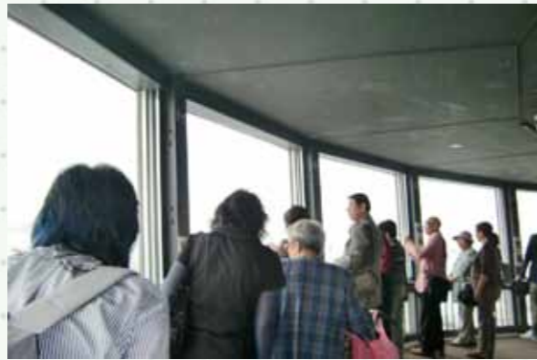
昨年と違って近かったなので、比較的余裕のある旅でした。 曇り空が心配でしたが時々晴れ間も出て展望台からの眺めもますます。