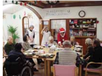
昼食は楽しみの一つですね

況を長く維持し、元気で『テディの家』に通って来ていただく為に、朝提供する野菜スープ、歩行訓練も含め機能訓練とレクリエーションにも力を入れ、美味しい昼食を召し上がっていただける様に一同力を合わせて頑張ります。