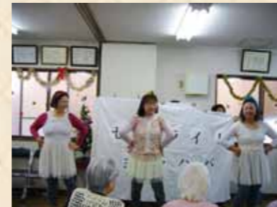
「ブルーライト横浜」の替え歌、セルライトヨコハマ