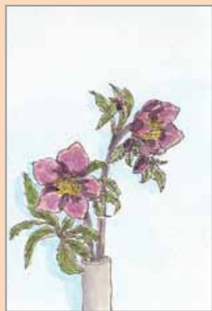
クリスマスローズ

○アロマオイルを使っ てのハンドマッサージ、美肌&アンチエイジングには内側からのケアが大事なことを興味津津で聞き入りました。