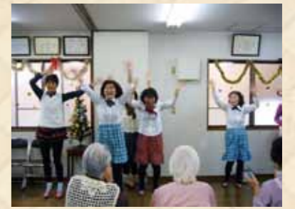
時流に乗ってみました「AKB48 さわりだけメドレー」