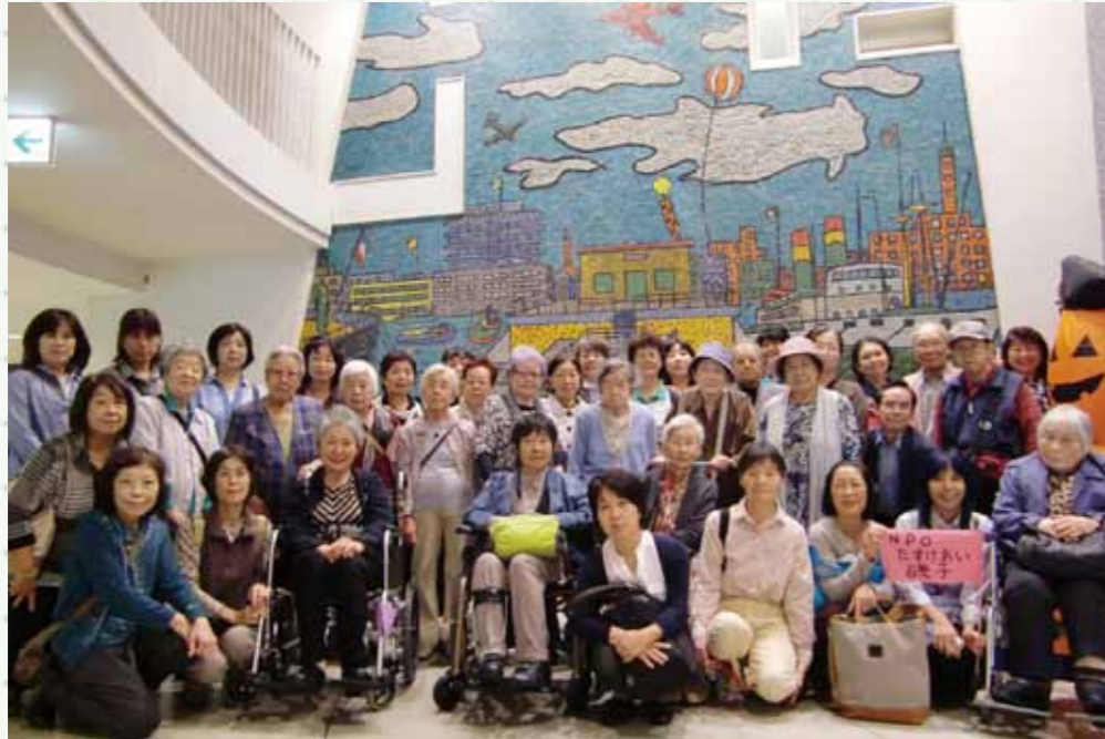
2009年にリニューアルオープンしたマリントワー。 横浜に住みながら、行ったことがない方も多くいらっしゃいました。