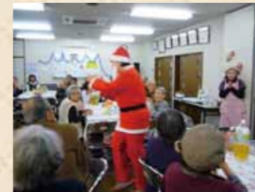
合間にサンタが盛り上げてくれます