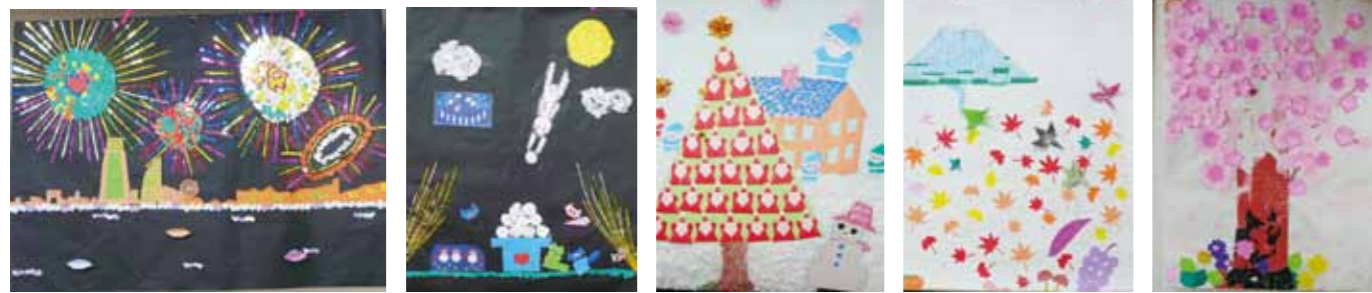
模造紙に毎月1作品、日替わりで完成させた壁画