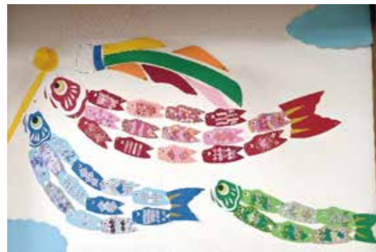
デイサービス こいのぼりが元気に泳いでいます