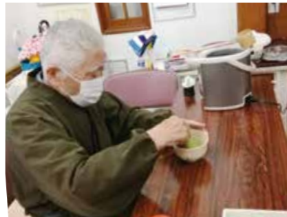
ご近所のお茶の先生にお茶会を開いていただきました。作法を教えてください、美味しく楽しい時間を過ごしました。