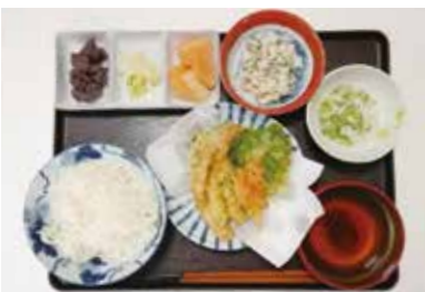
～デイの昼食～ そうめん・天ぷら・白和え・酢の物・漬物・煮豆・メロン

4丁目に空き物件があり移転を考え見学をしました。残念ながら今回は実現しませんでした。今はデイサービス・居宅介護支援事業所と訪問事業所との2拠点ですが、ゆくゆくは全事業同じ場所で活動したいと思っています。