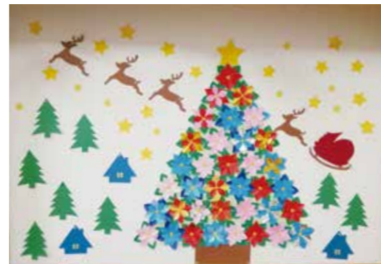
デイサービス トナカイが夢を運びます

毎年12月にはご利用者を迎えてのクリスマス会の準備に追われているところですが今年はコロナ禍の為中止となりました。何か代わるものにとクリスマスカードに一言添えて送りました