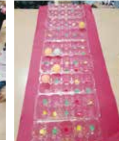
卵パックを利用したテーブルピンポン