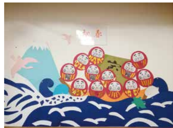
デイサービス だるまを乗せた宝船。今年はいいことありますように

訪問介護:ワーク時の検温に使ってもらうため、メンバー全員に非接触型温度計を配布しました。万が一身近に新型コロナウイルスを発症した方がいた場合のために、抗原検査キットを購入しました。(一度も使っていません)またご利用者宛に、検温、マスク着用の依頼を改めて書面にてお願いしました。