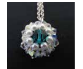
ペンダントトップ