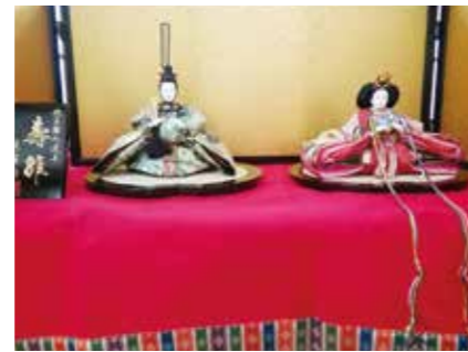
ご利用者の大切にされていた雛人形。飾ってほしいと寄贈してくださいました。