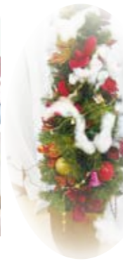
今年はコロナ禍で全体のクリスマス会が中止となってしまいました。少しでもクリスマス気分をと、有志がハンドベル演奏を披露しました。