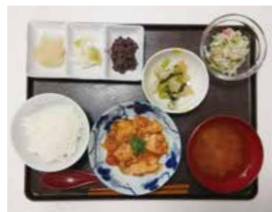
～デイの昼食～ 鶏肉のトマト煮込み・青菜の和え物・酢の物・味噌汁・漬物・りんご