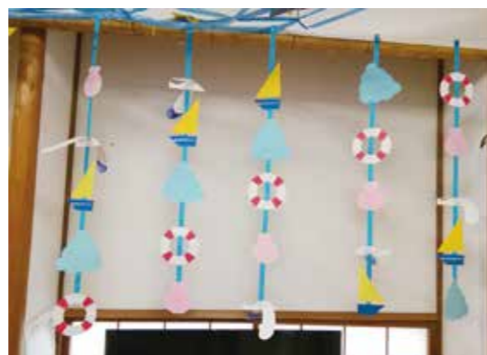
デイサービス 夏らしい涼しげなモールの飾りつけ

通所介護: コロナ対策でご利用者が少ない時はスタッフを減らしていましたが身体状況が低下されたご利用者が多くなってきたため通常の人員配置に戻しました。