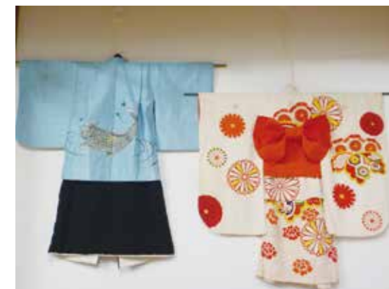
デイサービス 毎年飾っている七五三の着物。スタッフと弟さんの着物。お子さんも着たそうです。