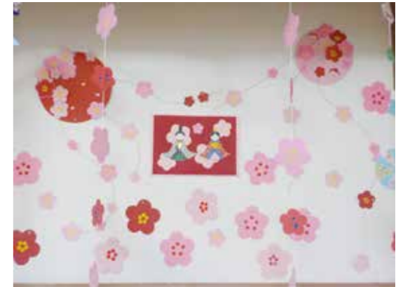
デイサービス 春が待ち遠しい!