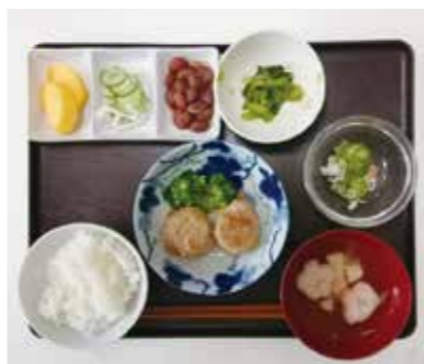
～デイの昼食～ 豆腐ハンバーグ・小松菜の辛子和え・酢の物・お吸い物・漬物・煮豆・柿

W.Coのお仕事・働き方を紹介する「わくわくワークフェスタ2020」が開催されました。今年は完全予約制で、各団体の仕事や働き方について、紹介されました。残念ながら、『たすけあい磯子』にマッチする方はいませんでしたが、参加したワーカーが他のW.Coの情報を知ることができました。