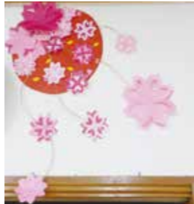
デイサービス 可愛い桜の花が咲きました