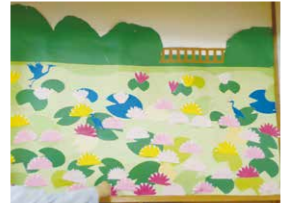
デイサービス 色鮮やかなスイレンの花が咲きました