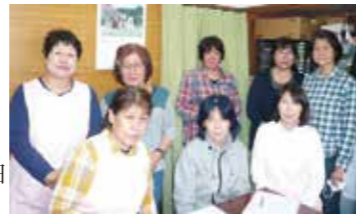
今回役員の改選が行われました