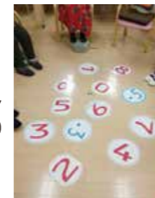
お手玉を使った得点ゲーム