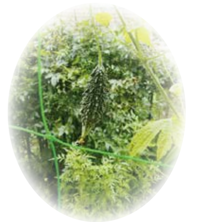
今年もゴーヤを植え、実がなりました。

デイサービス 今年もにぎやかな七夕飾り。ご利用者の皆さんにも願い事を書いていただきました。「いつまでも元気でいられますように」という願い事が多かったです