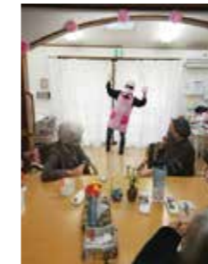
スタッフが鬼に扮した豆まき。

通所介護:コロナ禍でも感染症対策を行いながらできるだけ季節の行事は行ってきました。