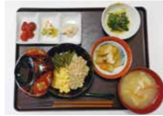
～デイの昼食～ 三色丼・がんも煮・味噌汁・漬物・青菜のおろし和え・苺

訪問介護: 一部ヘルパーよりワークに入ることの心配の連絡があり、今後について検討しました。『たすけあい磯子』としては、できる限りの予防策を講じ行政の情報を見ながら通常通りのワークを行い、ご利用者からの要望があれば応えて行く。ヘルパーに関しては申し出があった場合強制はできないので、相談の上対応することにしました。