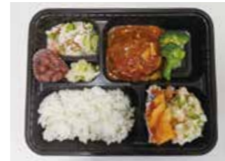
～デイの昼食～(訪問事務所用) 煮込みハンバーグ・酢の物・ポテトサラダ・味噌汁・漬物・煮豆・メロン