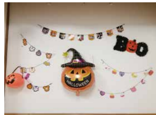
デイサービス ハロウィン