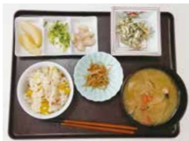
～デイの昼食～ 栗と舞茸の炊き込みご飯・漬物・具だくさん汁物・白和え(柿入り)・煮豆・リンゴのコンポート