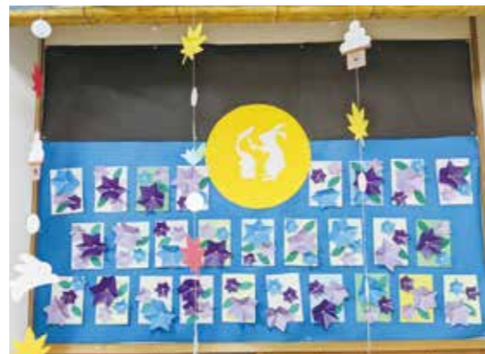
デイサービス 満月とうさぎ。背景には桔梗の花