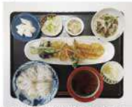
そうめん・天ぷら・酢の物・漬物・煮豆・梨

◆定例会 19(木)・21(土) 39名出席 情報公表制度第三者評価(訪問・通所) 今年より15分研修に続き、 30分の動画研修を追加しました。