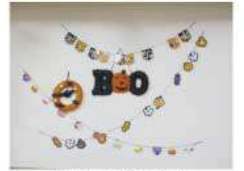
ハッピー・ハロウィン!