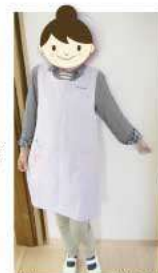
新しいエプロンを購入しました 主にデイサービスで使用

定例会にて「いいマスク」が欲しいと要望があり、「いいマスク」とは？耳が痛くならないマスクを購入し、配布しました。またコロナ対策として抗原検査キットを購入し、いざという時に使えるよう備えました。