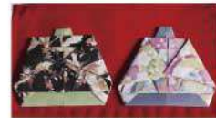
和紙で作ったお雛様