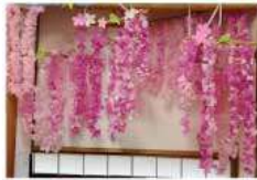
香りが感じられようようなしだれ桜が咲いています