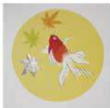
デイのボランティアさんの作品、敬老の日よせて