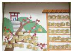
今年の抱負、願い事などを絵馬に書きました。

コロナが落ち着いてきたことを受け5月の総会を行うことに決定。また1年遅れの30周年記念行事も行うことになりました。準備委員会を設けました。