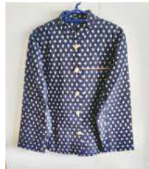
かすり地のブラウス ポケットのピンタック、 ボタンガステキでした。