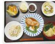
炊き込みご飯・鮭の焼きびたし・酢の物・澄まし汁・漬物・煮豆・みかん&キウイ