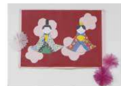
壁画の一部のおひなさま 仲良く微笑んでいます