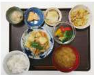
肉じゃが・野菜のオイスター炒め・サラダ・みそ汁・漬物・煮豆・メロン

生活クラブにてメンバー募集のチラシの配布を依頼しました。年がら年中メンバー募集です！