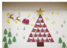
サンタからのプレゼントは何かな～?

30周年を記念して、何かみんなが参加できることはないかと、デイサービスの外にクリスマスの飾りつけをしました。折り紙で作ったカラフルなポインセチア、紙で作ったツリーやスタンドグラス、メンバーが少しずつ参加しました。