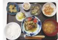
ビーマン肉詰め・切干大根の煮物・酢の物・みそ汁・漬物・煮豆・リンゴのコンポート

居宅介護で「ISBARC」についてのミニ研修を行いました。正しく「報告・連絡・相談」を行うためのコミュニケーションツール「R:報告者」「S:状況」「B:背景」「A:判断」「R:提案」「C:指示の再確認」最近は「ICT化」「BCP」「HACAP」など略語が多くなっていくのが大変です(汗)