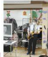
ボランティア 「昭和の唄べ」再興!