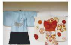
毎年飾られる七五三の着物