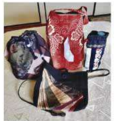
古布で作った小物 ポーチ・ティッシュケース 水筒入れ・ポシェット

和服リメイクで、コート・ベスト・チュニックなど、はぎれで小物づくりをして楽しませていました。