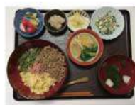
三色丼・白和え・煮びたし・すまし汁・漬物・煮豆・キウイ&イチゴ