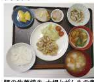
豚の生姜焼き・大根とがんもの煮物・筋の物・みそ汁・漬物・煮豆・バナナッブル

コロナが落ち着いてきたことを受け5月の総会を行うことに決定。また1年遅れの30周年記念行事も行うことになりました。準備委員会を設けました。