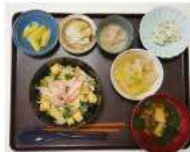
ちらし寿司・煮びたし・白和え・選まし汁・漬物・煮豆・キウイ

外部の総会もほとんどが書面で行われました。会議は良い面、悪い面ありますが、オンラインが主流となってきました。内部会議はすべて対面で行えています。