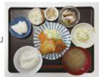
チキンカツ・ポテトサラダ・酢の物・スープ・漬物・煮豆・梨

・地域密着型通所介護 運営推進会議(書面にて) ・新型コロナウイルス感染症に係る 上乗せ加算終了