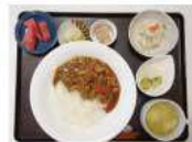
ハヤシライス・ポテトサラダ・マリネ・卵スープ・漬物・煮豆・スイカ