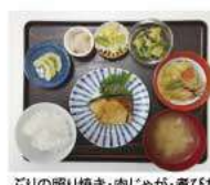
ぶりの照り焼き・肉じゃが・煮びたし・みそ汁・漬物・煮豆・キウイ

定例会にて「いいマスク」が欲しいと要望があり、「いいマスク」とは？耳が痛くならないマスクを購入し、配布しました。またコロナ対策として抗原検査キットを購入し、いざという時に使えるよう備えました。