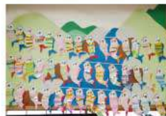
川にたくさんこのいのぼりが仲良く楽しそうに泳いでいます