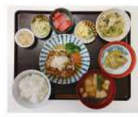
和風ハンバーグ・焼きなす・おひたし・みそ汁・漬物・煮豆・スイカ