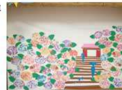
雨降りのアジサイ色鮮やかに咲いています

産業医の「ひろ内科クリニック」をはじめ、集団接種、かかりつけ医による新型コロナウイルスワクチン接種が、10日(土)より接種券の届いた方から始まりました。